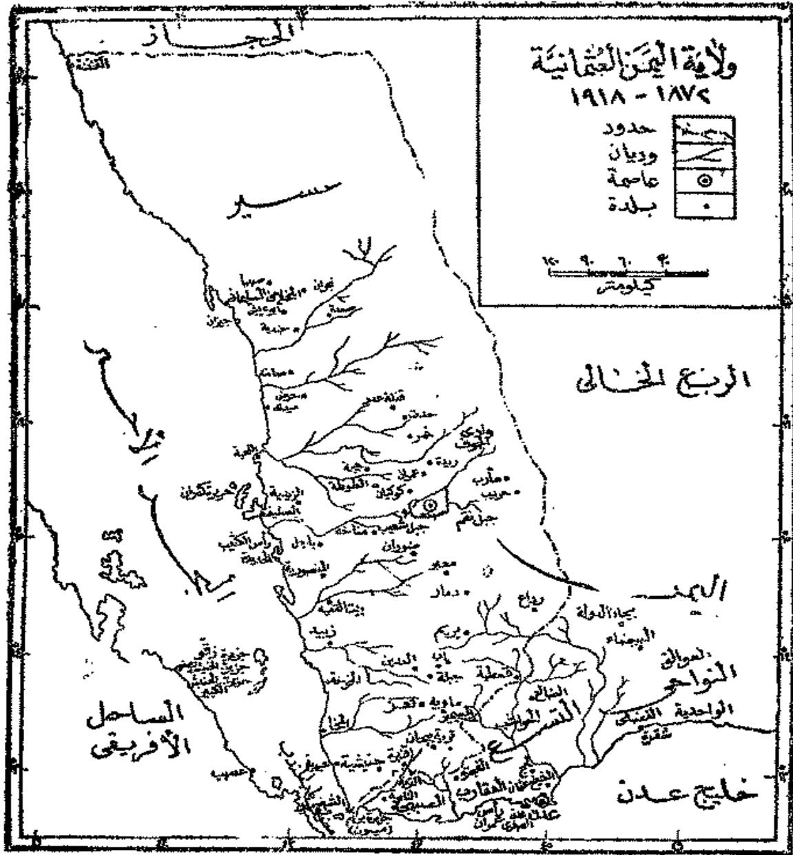
خريطة توضيحية لحدود ولاية اليمن في الفترة ما بين عامي ( 1872 - 1918 )