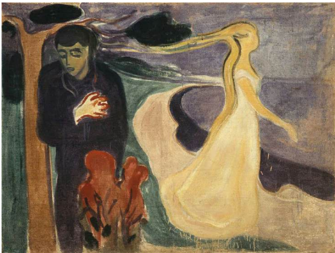
اسم اللوحة: Separation - Edvard Munch