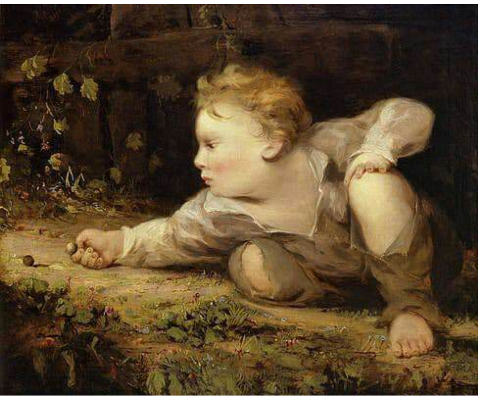
اسم الفنان: David Gilmour