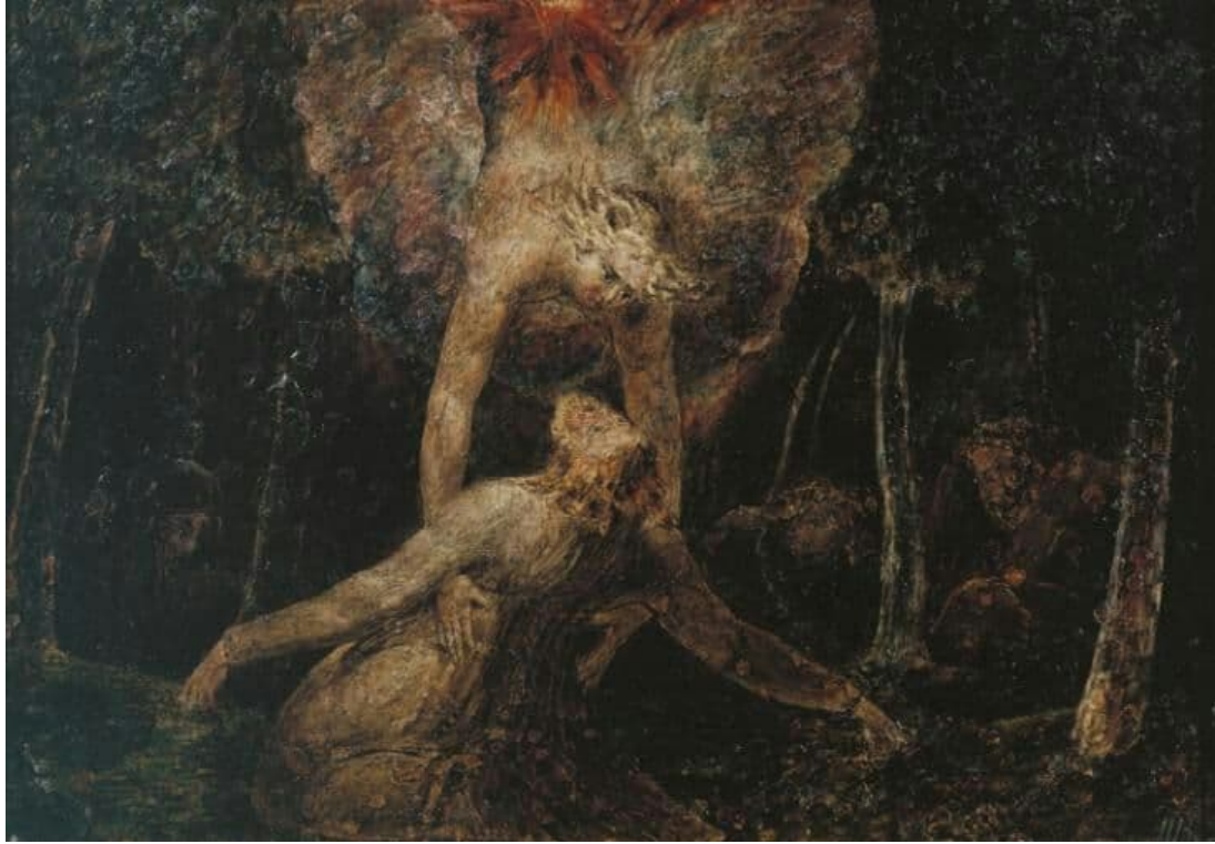
The Agony in the garden - William Blake: اسم اللوحة: