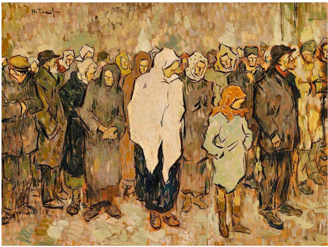
اسم اللوحة: Bread Line - Nicolae Tonitza