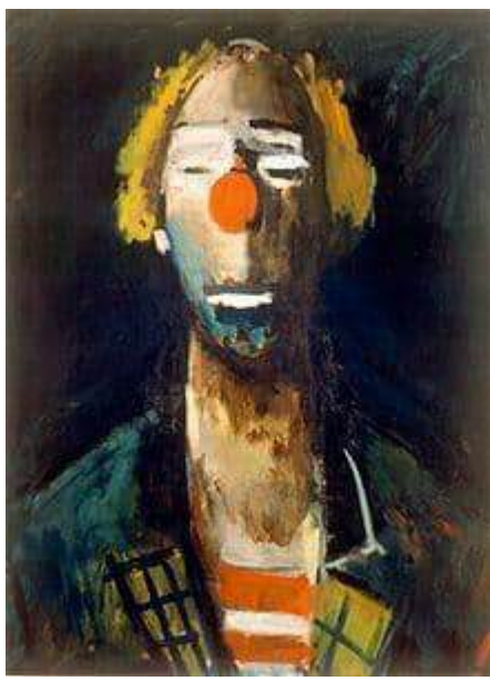
اسم الفنان: Joseph Kutter