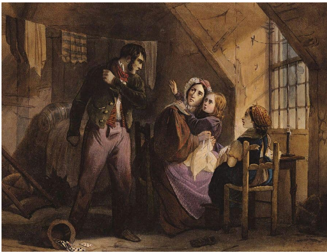
اسم الرسام: Jules David